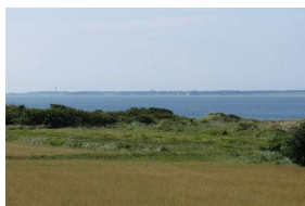
Ausblick zur Nordsee