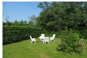
Grillmöglichkeit im Garten