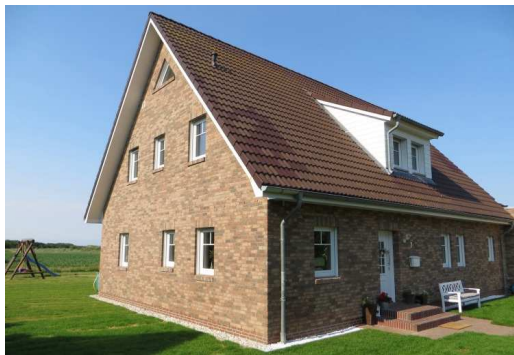
Einfamilienhaus (Baujahr 2011)